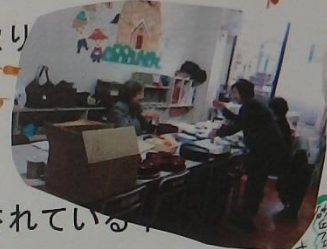
砂丘フェスティバルの準備

内灘砂丘フェスティバルは、1998 年から内灘町で開催されている。この内灘砂丘フェスティバルに携わるボランティアを 1998 年 (平成 10 年) 第 1 回内灘砂丘フェスティバルから行っています。内灘砂丘フェスティバルでは舞台を飾るオブジェの製作も行っています。