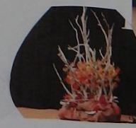
砂丘フェスティバルのオブジェ