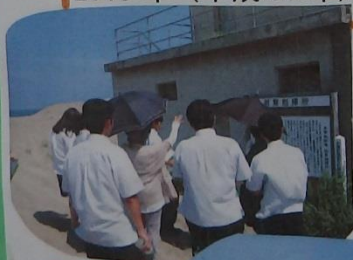
砂丘フェスティバルの準備