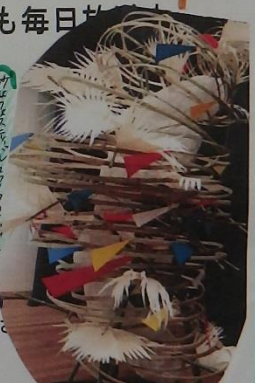
砂丘フェスティバルのオブジェ