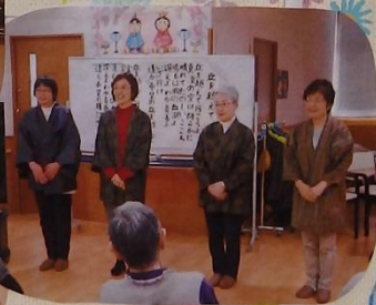
↑ (2018. 3. 15 「デイサービス」 おはなし会)

メンバーは、現在7名です。♡ 絵本と子どもたちが大好きな歌々 と一緒に活動しませんか? ♡お声をかけてくだされば、施設へ 『おはなし会』をお届けします。 (お問い合わせは 内灘町社会福祉協議会)